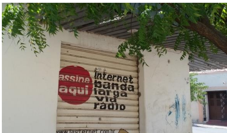
Figura 02: Provedor de Internet