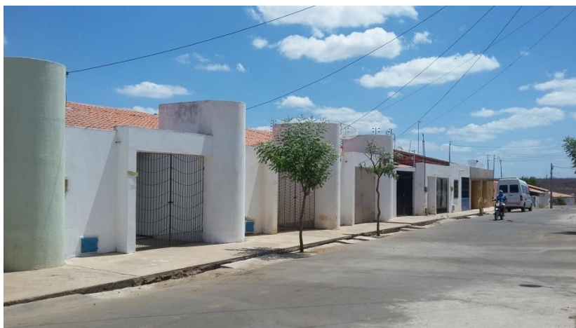
Figura 05: Casas construídas para alugar na Rua do Rosário