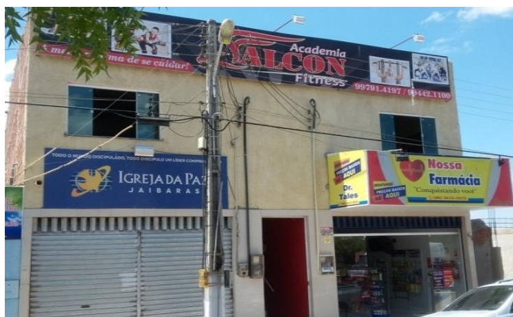
Figura 03: Rua do Comercio - Academia

Na atualidade, podemos pensar nesta dinâmica dos lugares longe dos centros mais dinâmicos, pela absorção no campo cada vez mais de tecnologias e sistemas produtivos surgidos da aplicação do conhecimento científico, os quais são desenvolvidos nas cidades. (SOBARZO, 2010). O centro do distrito de Jaibaras foi se modificando conforme a necessidade da população, mas com destaque para os serviços buscados pelos universitários. A exemplo da presença de duas academias e serviços de reprodução de cópias. (Figura 03 e 04).