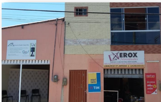
Figura 04: Rua do Comércio - Serviço de reprodução de cópia.